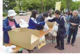
パンの販売にはヤングボランティアも

去る4月25日8時から小金原公園にて地区社協主催の『朝市』が開催されました。当日は各店舗に長蛇の列ができ、多くの来場者で賑わいました。特にタマゴのつかみ取りでは開始時間前から長蛇の