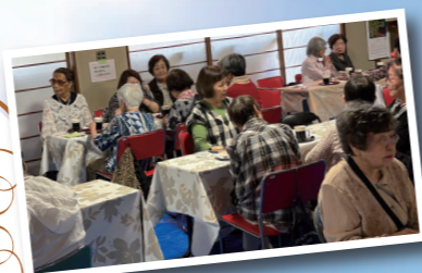
毎回、参加者が40人以上と大賑わいの「ちよつといっぷく」。いつもいろんな話で盛り上がっています。(写真は2026年5月)

会場: 小金原老人福祉センター内 ※小金原地域の65歳以上の方 お茶代100円、スリッパ持参