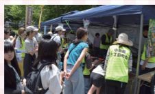
射的コーナーに子供たち殺到。