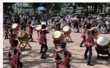
二番手は9丁目太鼓で大いに盛り上がり。