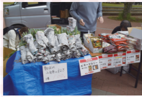
農家のネギも10分で売り切れに!