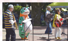
有吉&エンガワ&ナカタの歌と演奏。