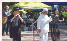
たけちゃんバンドの熱唱。