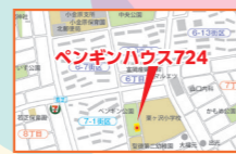
※駐車場はありません。