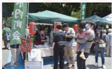
匂いに引き寄せられる定番焼き鳥。