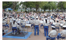
松戸市消防音楽隊がオープニング。