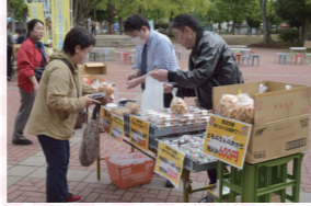
いろいろなお菓子もよく売れてました