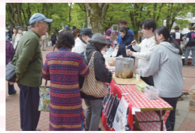
ヤングボランティアさんも大活躍!