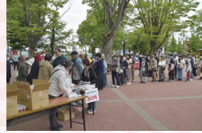
1回50円のタマゴのつかみ取りに長蛇の列