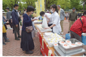
メンチバーガーにとんかつも大人気!