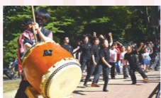
最後は皆んなでジャンボリーミッキー。

小金原地区会主催(小金原地区社協共催)の2026年度小金原フェスタが、6月6日に小金原公園で開催されました。初夏の青空の下、小さなお子さんからシニアの方まで幅広い世代が来場し、公園内は朝から夕方まで活気にあふれていました。会場には、町会・自治会を中心とした23のお店や遊び場がずらりと並び、昔ながらの縁日を思わせるブースが大人気。子どもたちの笑い声が絶えず、家族連れの姿も多く見られました。ステージでは、7つの団体が出演、ダンス、演奏など、多彩なパフォーマンスを披露。出演者の熱気に応えるように、観客からは大きな拍手が送られ、会場全体が一体となって盛り上がりしました。