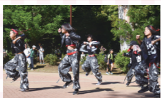
POP☆スタジオ88の華麗なるダンス。