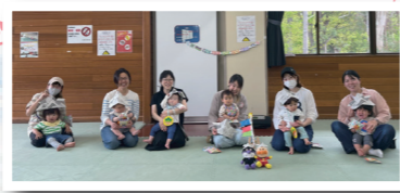
新聞紙で作った兜に男の子も女の子も大歓迎! 手作りメダルのプレゼントも(2026年5月)