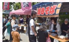
焼きそばや玉こんにゃくも大人気。