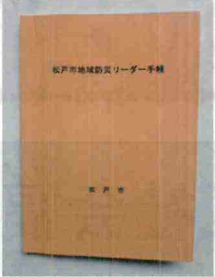
防災リーダー手帳

町会・自治会においての最大関心事は防災対策とされていますが、その役割の担い手が「防災リーダー」です。では「防災リーダー」について詳しく説明しましょう。 (正式名称「松戸市地域防災リーダー」) * 町会・自治会から推薦された者から市長が委嘱する。 * 市の所管部署は総務部危機管理課です。 * 任期は3年で今年5月29日(金)に市民会館にて新たな防災リーダーへの委嘱式が行われました。 * 任務は平常時においては町会・自治会に対し、訓練・研修等で取得した知識・技術の普及を図ること。災害発生時の任務は地域住民と協力して、消火・救出・救護・避難誘導・避難所運営等を行うことです。