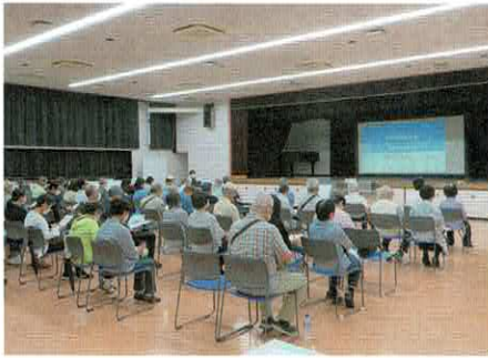
新松戸医療講演会