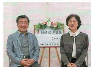
祝 笑顔がいっぱい 結婚50年