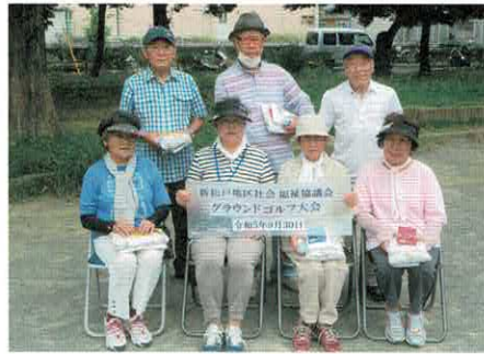
グラウンドゴルフ大会入賞者