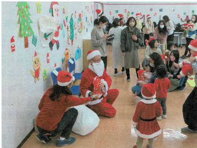
子育てサロン「ひよっこひろば」クリスマス会