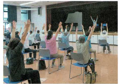
いきいきサロン体操教室