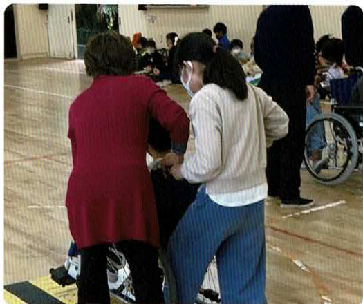
▲車いす体験の様子