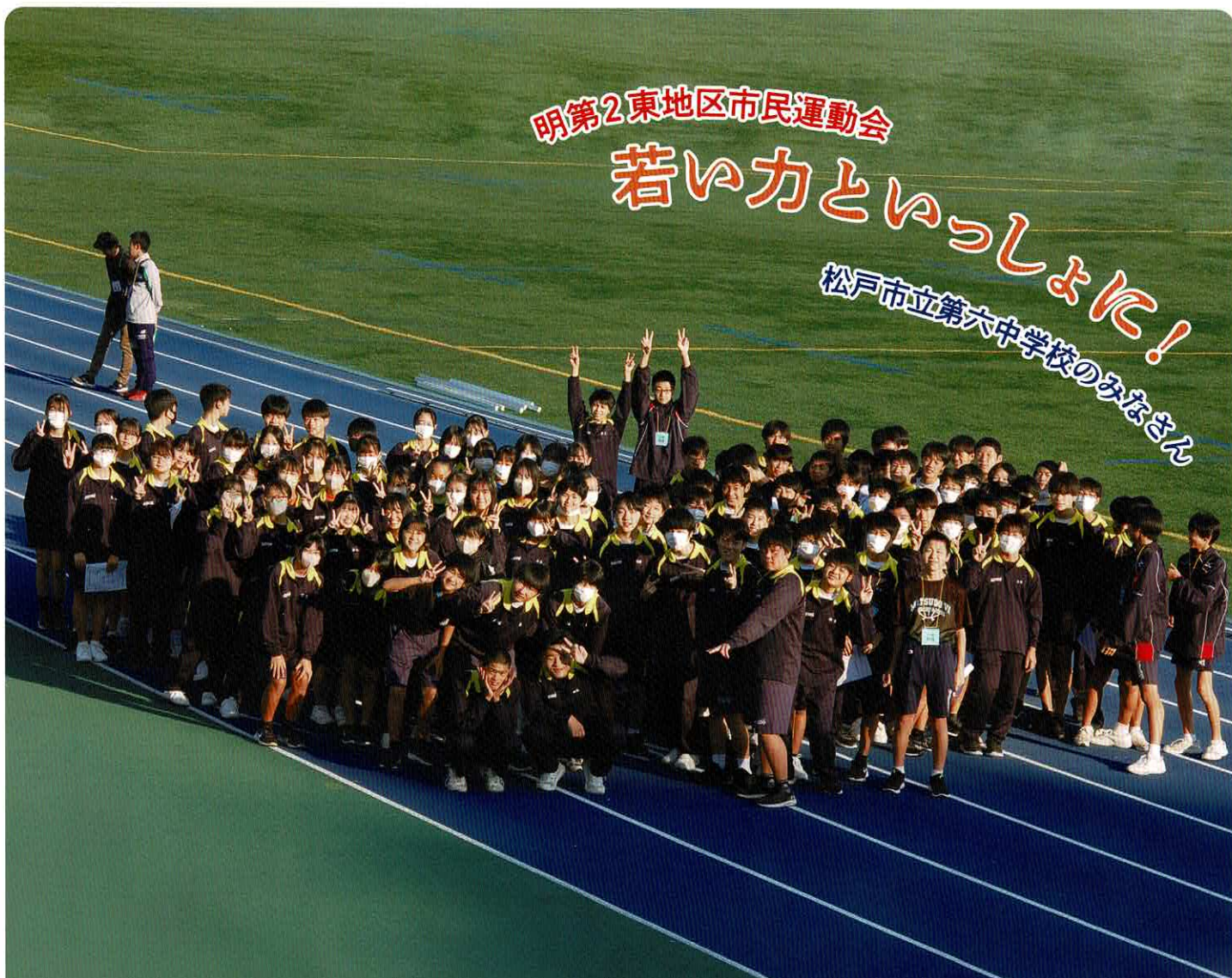
松戸運動公園陸上競技場にて

11月3日の文化の日、松戸運動公園陸上競技場で開催された「明第2東地区市民運動会」に、松戸市立第六中学校の生徒さんが100人以上、ボランティアとして参加してくれました。