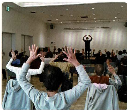
▲介護予防のための体操を参加者のみなさんで

明第2東地域包括支援センターでは、毎年一回秋頃に認知症予防教室を開催しています。高齢者のみなさんに認知症を予防するための知識や日頃から取り組める体操等の情報発信をしています。今年も、10月12・13、26・27日の4日間開催しました。内容は毎回異なるものを行いました。26日は自宅でも行える内容の体操を実施しました。12日は、「介護予防は笑いから」をテーマに、講師兼演者の方をお招きして、認知症の知識や