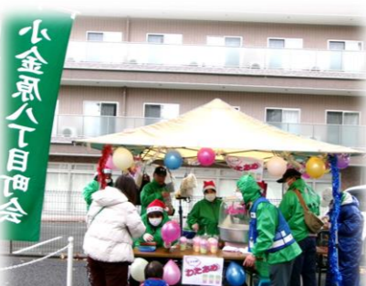
八丁目町会の『わたあめ』