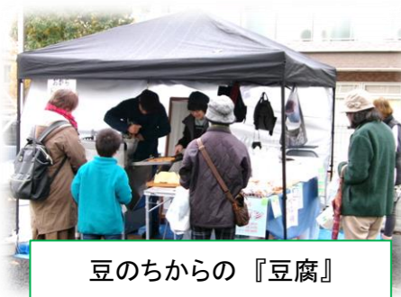
豆のちからの『豆腐』