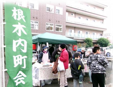
根木内町会の『焼き鳥』