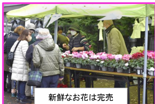
新鮮なお花は完売