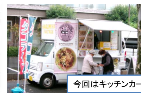
今回はキッチンカーも来てくれました！