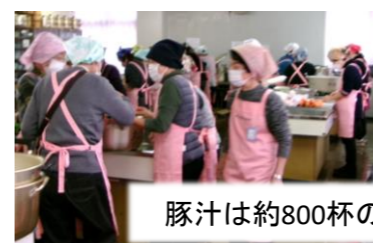
豚汁は約800杯の大人気！