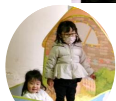
おやこタイムにもたくさん 遊びにきてくれました