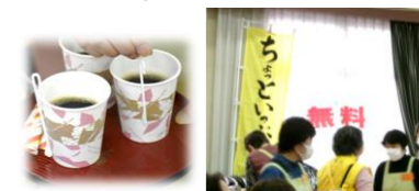
コーヒー・紅茶で ちょっといっぷくした人は約400人