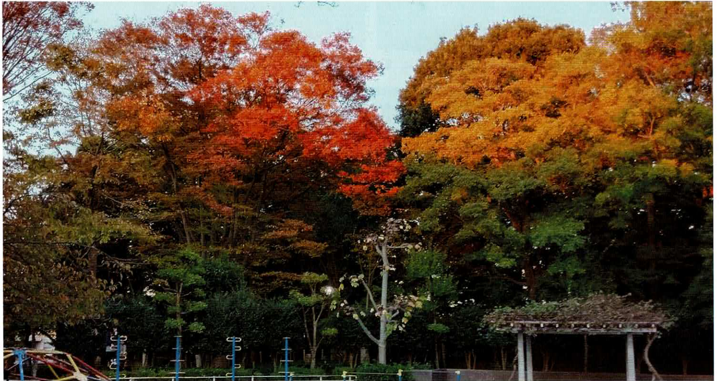
東部スポーツパーク公園にて撮影

編集：東部地区社会福祉協議会 広報部会 発行：吉澤 正一 〒270-2222 松戸市高塚新田494-9（東部市民センター内） 電話／047-391-6581 FAX／047-703-8866 eメール tobu@matsudo-shakyo.com