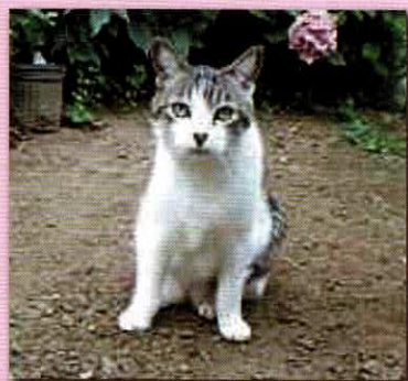
「ごんちゃん」N・Iさん