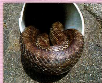
「地域ヘビのカズオ君」H・Yさん