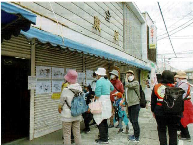
六実駅前 東屋商店 昔の「みの雨具」と山口豊専画伯の風景画