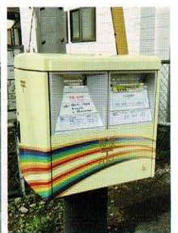
六実駅前 夢のポスト