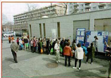
地域の居場所マップ