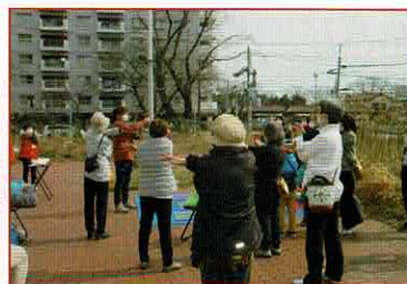
運動不足解消ストレッチ