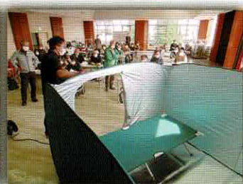
パーティーション&簡易ベッド