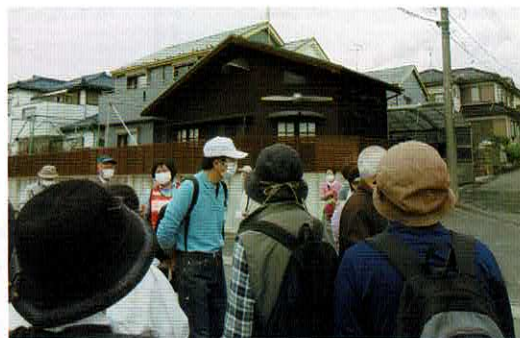
プロペラのある家 プロペラと壁が特徴