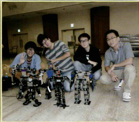
研究会のみなさん

この体験を通して、工学への関心と、未来への夢をひろげるきっかけになればと思いました。