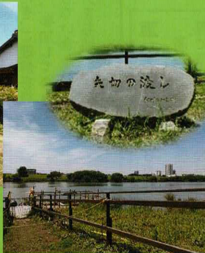
矢切の渡し渡船場