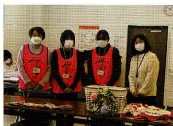
健康推進委員の皆さんと保健師さん