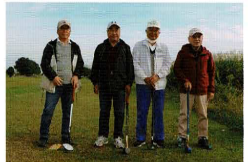
優勝チーム古ヶ崎新田第一町会のメンバー

健康ひろば フレイルとは? 12月2日(金)健康ひろばを開催しました。今回はフレイルについて正しく理解してもらうことでした。フレイル予防の一つであるちょっとした運動や脳トレをしました。