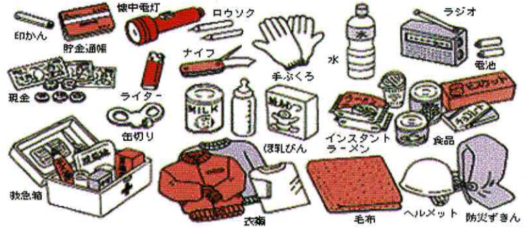
最低7日間の食料と水が必要と言われています