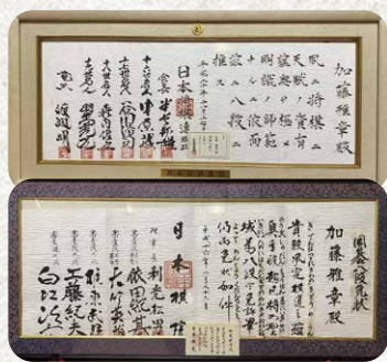
▲囲碁八段(下)と、将棋八段(上)の免許

K ：囲碁と将棋の免許でアマは最高位が8段です。囲碁と将棋の両方の8段の免許を持っています。なかなか一つでも大変です。きっかけは20年前、第六中学校の50周年の委員長をしたあと、生徒に囲碁の指導を頼まれました。指導者が免許を持たないのは