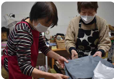
《活動中の様子》自宅の整理整頓を一緒にお手伝い（左：協力会員 右：利用会員）

をいたします。また、ふれあいサービスの担い手となる協力会員も募集しています。担い手になるためには協力会員基礎研修を受講する必要があります。