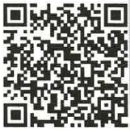
松戸市虐待防止条例 ▲詳しくはこちら▲