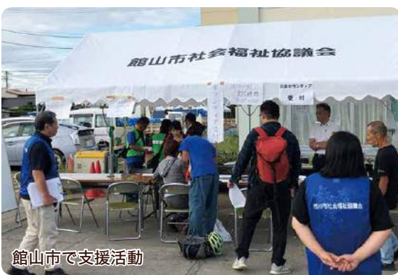
館山市で支援活動

【ボランティアへの主なニーズ】 ブルーシート張り、倒木の伐採、瓦等がれきの撤去、土嚢袋づくり等