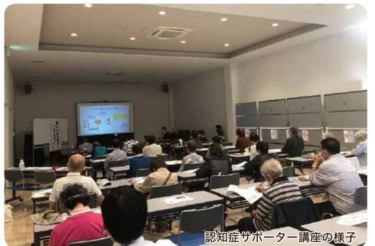
認知症サポーター講座の様子