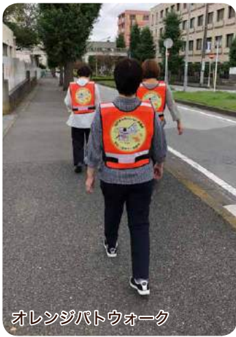
オレンジパトウォーク

もちろん様々な世代の方の参加も大歓迎です。毎週の参加は難しいけど、時々だったら参加できるという方でも大丈夫です。みな