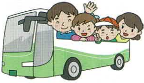
グラウンドゴルフとバス旅行は町内親睦の花形!