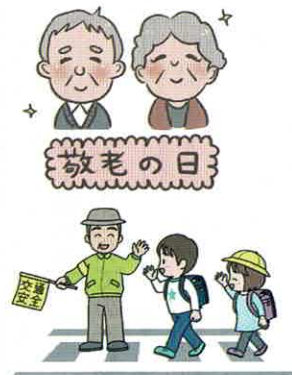
敬老祝いも! 学童登校の見守りも!