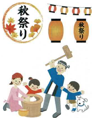
お祭りも! 餅つきも!