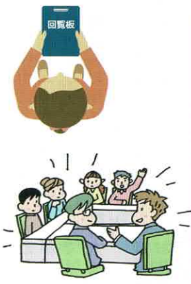
打ち合わせ、回覧も大切!

防災訓練、納涼大会、グラウンドゴルフ大会、音楽祭、敬老祝いの実施など。 ④ 年度ごとの事業計画に基づき防犯・防災、文化教養、環境美化、福祉などの諸活動の実施。 ⑤ 役員の高齢化対応を検討したい。敬老祝いの訪問による情報連絡を密にする。夜間パトロールの実施。