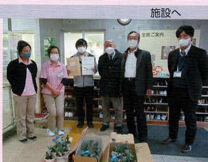
島村洗心苑へ年賀状メッセージを贈呈