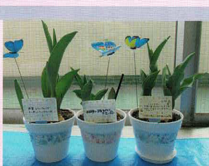
和名ヶ谷中学校での贈呈式。生徒会より年賀状メッセージとチューリップをいただきました。