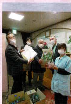
緑風園へ 和名のチューリップを 贈呈