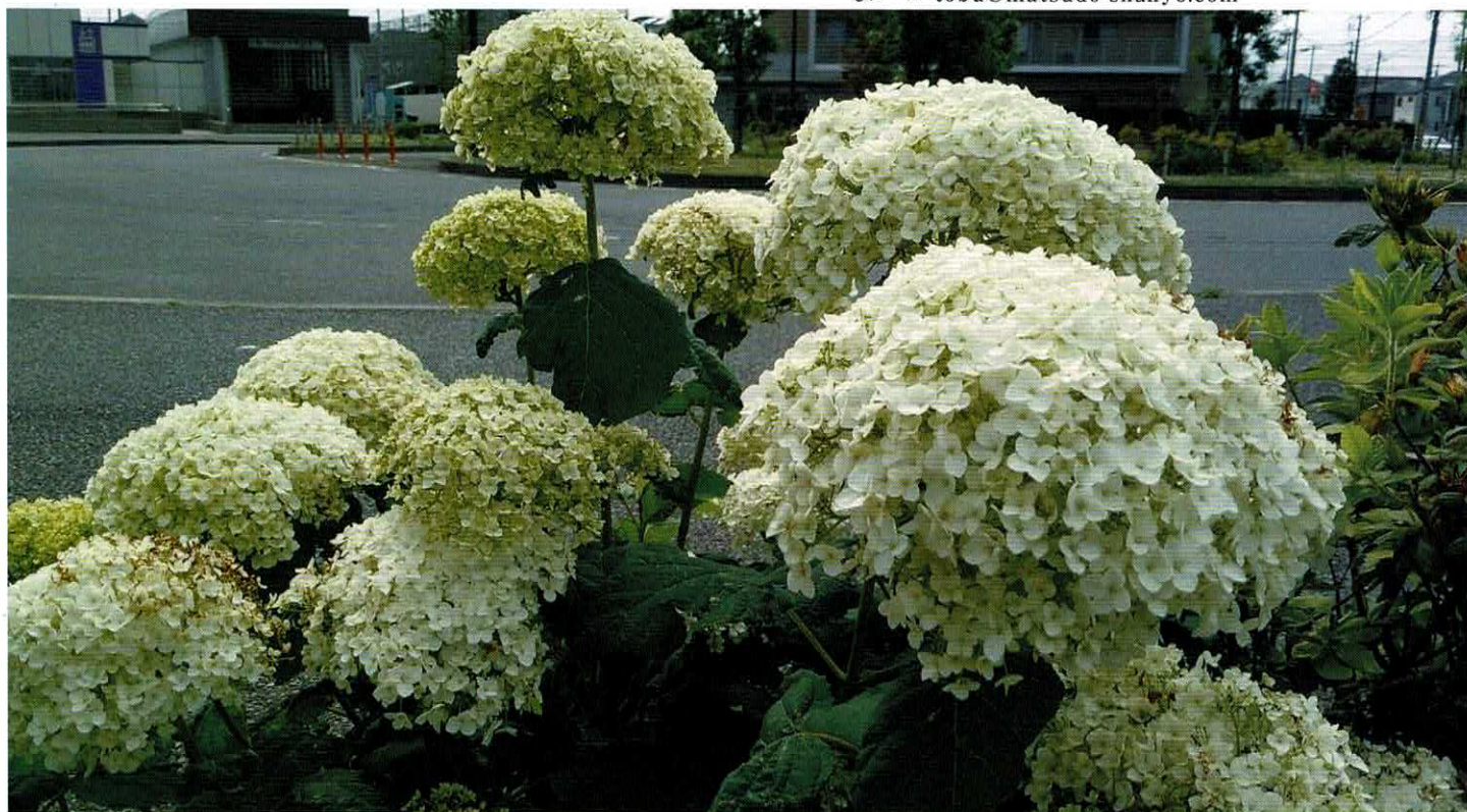
6月上旬、秋山駅前にて撮影

編集：東部地区社会福祉協議会 広報部会 発行：吉澤 正一 〒270-2222 松戸市高塚新田494-9（東部市民センター内） 電話／047-391-6581 FAX／047-703-8866 eメール tobu@matsudo-shakyo.com