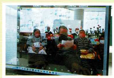
▲和名ヶ谷小学校と親愛の丘のオンライン交流