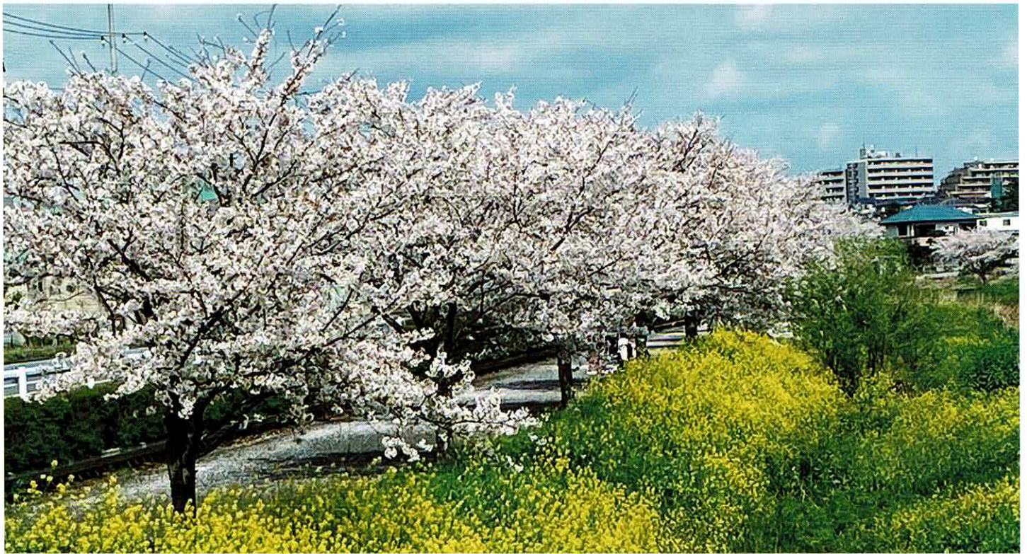
国分川「子の神橋」付近より令和3年3月29日撮影