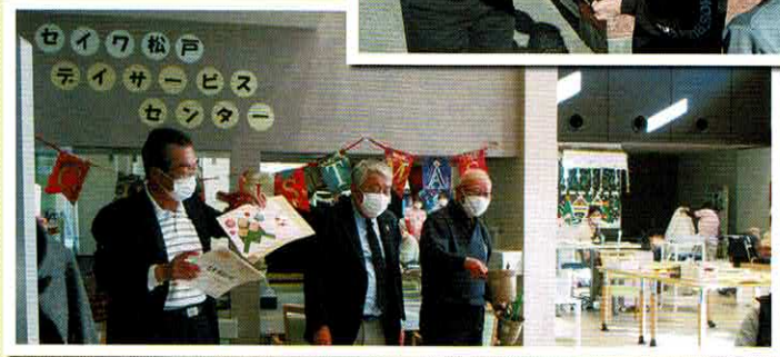
▲セイワ松戸へアイスチューリップをお渡ししました。