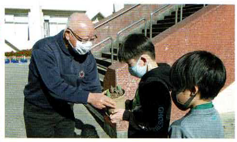
大橋小学校児童が育てた鉢の回収▶

▲「アイスチューリップ」は、一度球根を冷蔵施設に入れ、その後自然の温度環境にすることで、チューリップに「春が来た!」と勘違いをさせて、冬に花を咲かせるチューリップのことです。