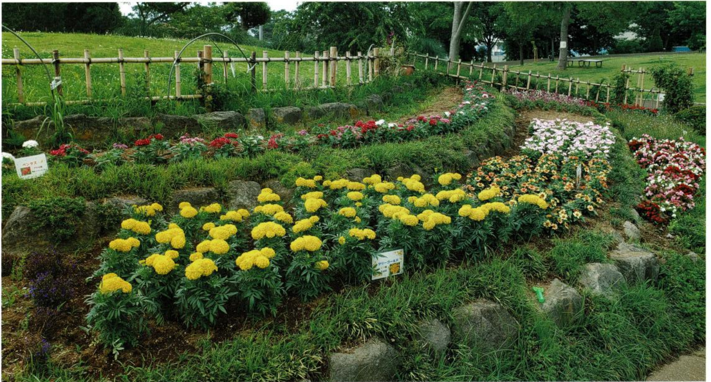
東松戸ゆいの花公園のマリーゴールド (6月21日撮影)