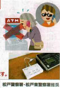
松戸警察署・松戸東警察署推奨

*本事業は、松戸市で生活関連サービスを展開するヤマト運輸株式会社（「ネコサポ」）が松戸市より業務委託を受け、「電話de詐欺」の撃退機器の申込受付・設置を行います