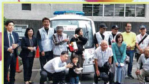
運転手さんも一緒に！

2023. 1. 10から運用が開始された小金原のガスロが5月31日（水）に1000人目の方をお乗せすることができました。