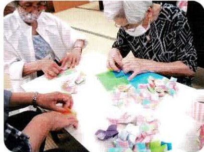
ひまわりサロン 八ヶ崎会館

馬橋東市民センター 第2(金) 八ヶ崎会館 第1(木) 三日月会館 第1(水) 中和倉集会所 第3(火) 各会場とも 13:30~15:30