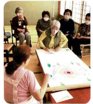
馬橋東市民センター コインゲーム

6月は市健康推進課の方の講演 『元気で寿命を延ばす3本の柱』 (運動・食事による栄養・社会参加)について学びました。