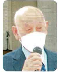
馬橋地区社会福祉協議会

馬橋地区社協の、評議員会を四年ぶりに、来賓を お迎えし、開催いたしました。 令和4年度の事業・会計報告に続き今年度の事業 計画と予算案が提案され、承認されました。