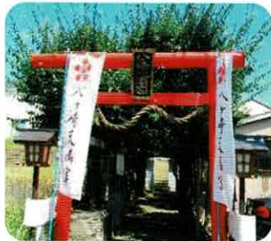
鳥居が綺麗になりました

現在、氏子(奉賛会会員)280世帯余りの会員様から年会費をいただき、氏子代表の理事、協力員を含めた17名で、1月に元旦祭と合格祈願祭、2月に節分祭、7月に夏祭り、10月に例大祭、11月に七五三祭りの年間行事を執り行っております。