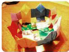
折り紙の奴さんで作る小物入れ