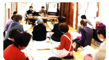
三ヶ月会場 お琴の演奏