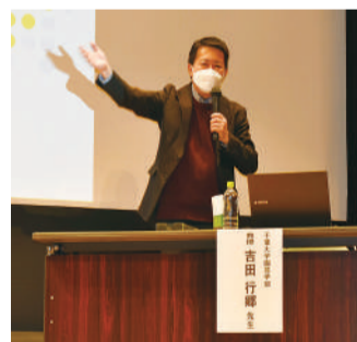
吉田教授による講演