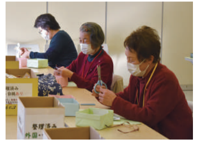
寄付で頂いた使用済み切手を整理するボランティア活動

地域での社会的役割や生きがいを持つことは、地域への愛着につながります。地域でできるボランティア活動や交流を通じて自分の住むまちをより豊かにしましょう。