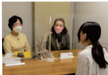
福祉相談員による相談会

悩みを抱えている人が地域の中で孤立しないよう、住民同士でも見守りや支え合いが大切です。また困った時でも、住み慣れた地域の中で一人ひとりが自分らしく暮らせるような支援や相談先が必要です。