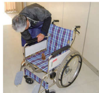
施設で使用する車いすをきれいにしています