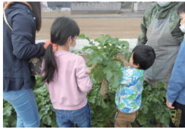
ふれあい広場で大根堀り体験

地域では子どもから高齢者までさまざまな世代が支え合いながら暮らしていくことが大切です。地域で行われるイベントはそのまちの住民同士の交流をはかる上で重要な役割を果たしています。