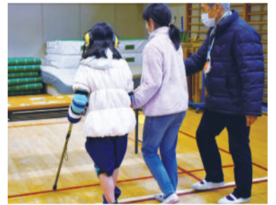
高齢者の体の感覚を体験中の小学生

高齢者、障がい者、子どもなどに関わらずお互いの価値を認め支え合っていくことが重要です。福祉教育や地域活動を通して、まち全体で次代の担い手を育てていく必要があります。