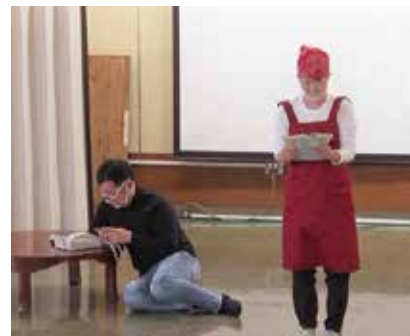
エンターテイメント集団響王による事例披露

【問合せ】松戸市成年後見支援センター (平日8:30～17:00) ☎047(710)6676