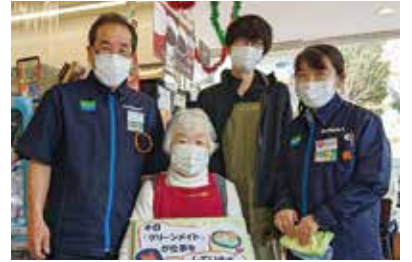
活動者と活動を支える人たち