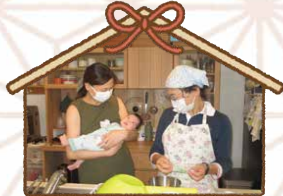
出生直後の支援で調理のお手伝い