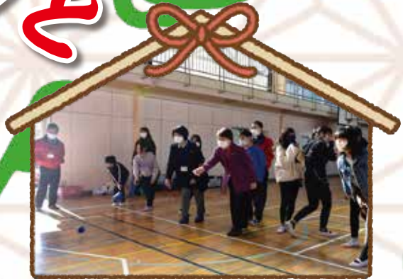
ハートフル交流会でボッチャ体験