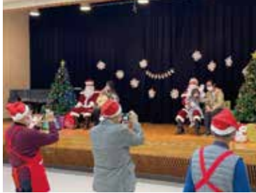
サンタさんと撮影会