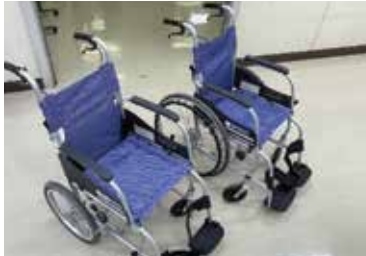
貸し出し用の車いす