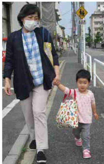
さあ、お家まで帰ろう♪

ファミリー・サポートは育児の援助を受けたい人(利用会員)と援助を行いたい人(提供会員)をつなぎ、地域の中で育児の助け合いを行う会員組織です。