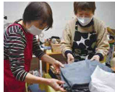
《活動中の様子》 自宅の整理整頓を一緒にお手伝い