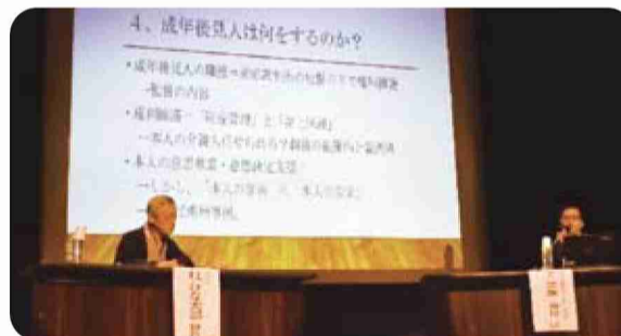
桂師匠と萩原氏の講演の様子