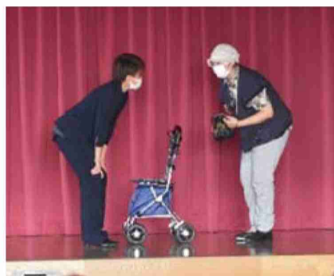
認知症とみられる人への声かけの仕方を学びました

これからも松戸市社会福祉協議会は、松戸市が目指す「認知症になっても安心して暮らせる街まつど」の推進を支援していきます。