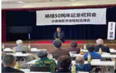
結婚50周年記念祝賀会 落語鑑賞