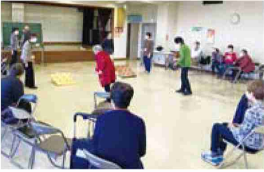
あじさいサロンで輪投げを楽しむ高齢者

松戸市社協のマスコットキャラクター「まっころん」がまちを歩いて、地域のみんなとふれあいます。今回は「本土寺」や「東禅寺」、「大谷口歴史公園」など由緒ある名所の多い小金地区に出かけてみました。親切な人たちにまちのことを教えてもらったようです。