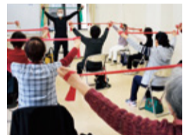
セラバンドを使った運動