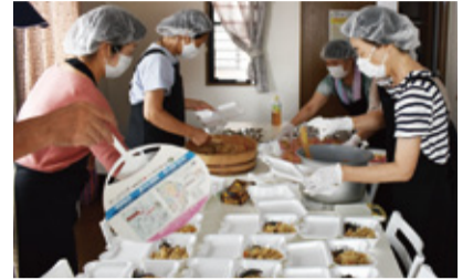
心をこめて手作りしています

【問合せ】松戸市新松戸3-27 新松戸市民センター3階 ☎FAX(341)9211 開所時間:9:30~16:30 (休)土日祝 第1月