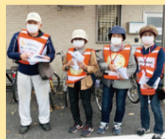
第2西高齢者いきいき安心センター前にて

りを行うパトウォークなどが市内15か所の高齢者いきいき安心センターにて実施されています。活動者の中には、健康維持や情報収集のために始めたという声がかれ、自分のために始めた活動が他者のためになっていると実感日々取り組んでいます。 “安心して地域で過ごしてほしい”という気持ちが丁寧な声かけと見守りの姿勢に現れている活動内容となっています。