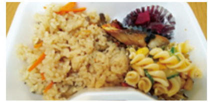
おいしそうなお弁当ができました