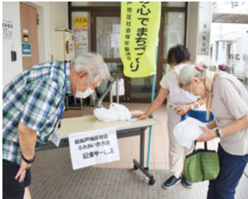
新松戸地区社協ののぼり旗を立てて配食開始!

新松戸地区社協では、コロナ禍で市民センターでのふれあい会食会(70歳以上の一人暮らしの人対象)を3月から休止していましたが、代わりに9月から配食サービスを試行しています。この配食は、いくつかの拠点を設けて利用者に取りに来てもらっています。まっころんもお手伝いのために配食場所へ行ってきました。