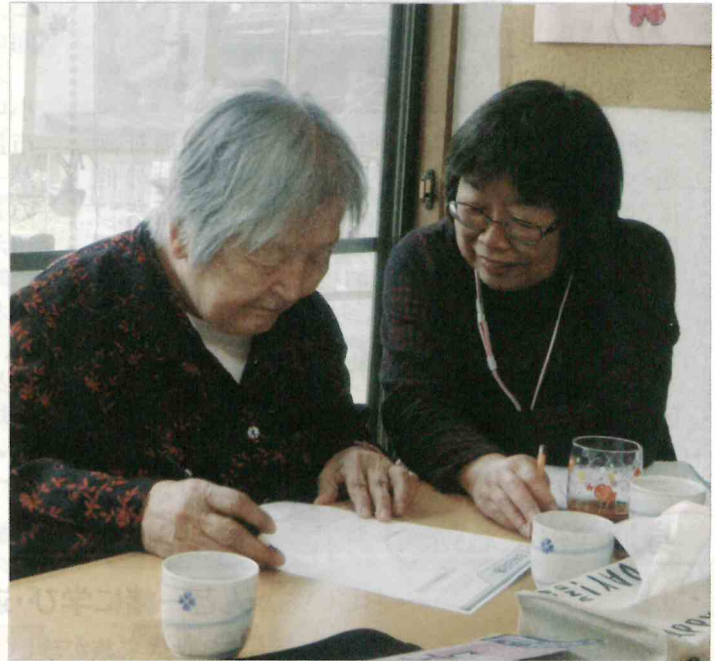
お手伝いをしながら楽しくお話をしているボランティアさん(右)