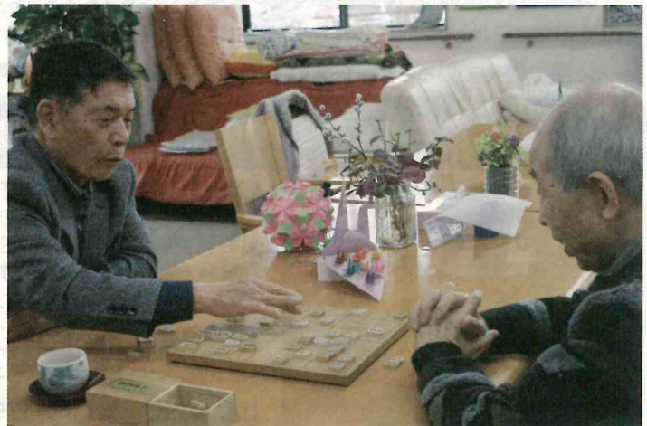
いつも真剣勝負のボランティアさん(左)今日の軍配はどちらに?

開催場所 松戸市社会福祉協議会ボランティア室(松戸市上矢切299-1)ほか 講師 特定非営利活動法人 日本傾聴ボランティア協会(傾聴コース) 矢切高齢者いきいき安心センター(認知症サポーター養成教室) 松戸市社協職員